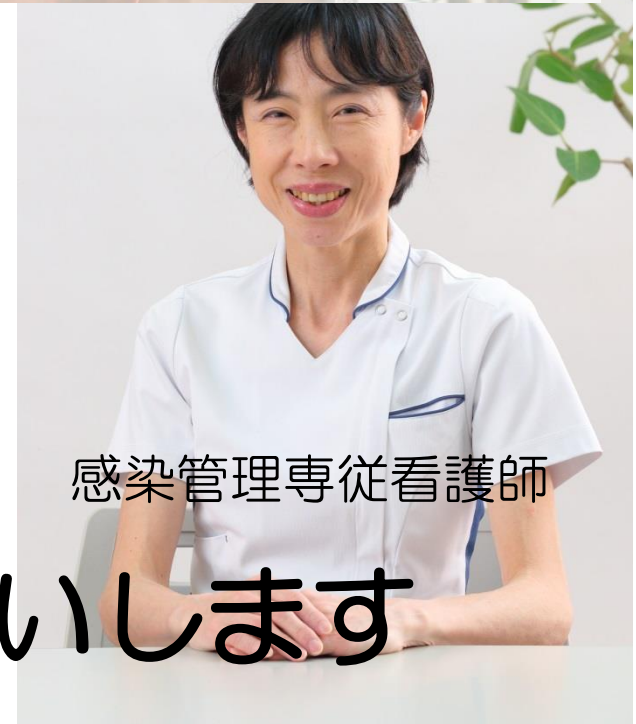
感染管理専従看護師