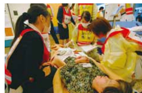
黄色エリア(中等症)受入れエリア

者を受入れた。また、傷病者を病院屋上にヘリで搬送する訓練も実施しました。神奈川県内から参集した神奈川DMAT7チームは、主に赤エリア(重症受入エリア)を中心に診療支援を行いました。当院では、今回の訓練での反省点を踏まえて、今後も訓練を重ねる事で、実際の災害が起きた場合に出来るだけ多くの傷病者を迅速に、かつ安全に受入れるようにしたいと考えています。