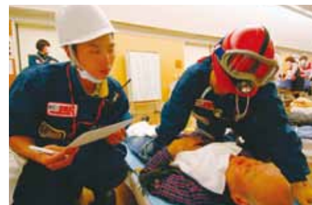
神奈川DMATも訓練に参加