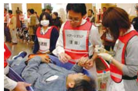
トリアージエリア