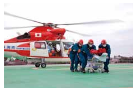
横浜市消防署ヘリで患者搬送