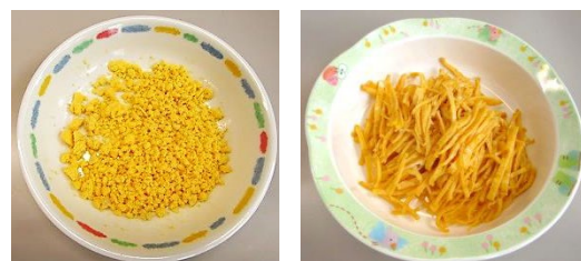
経口負荷試験食材の一例（卵）